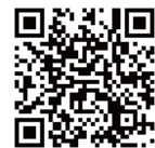
石神井プレーパークHP

石神井・冒険遊びの会主催の活動 開催情報、日時など詳細は HP で。(http://shakuji-pp.sunnyday.jp/)