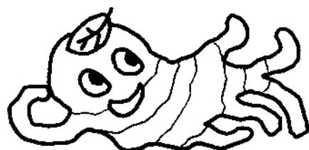
シプジャーレクパ星人 ソーダッタノカ君